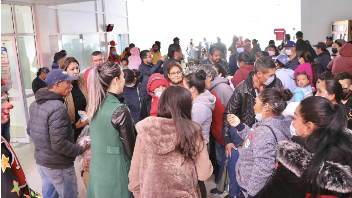
Entrega de apoyos a la ciudadanía del sector más vulnerable, en las instalaciones del SMDIF.