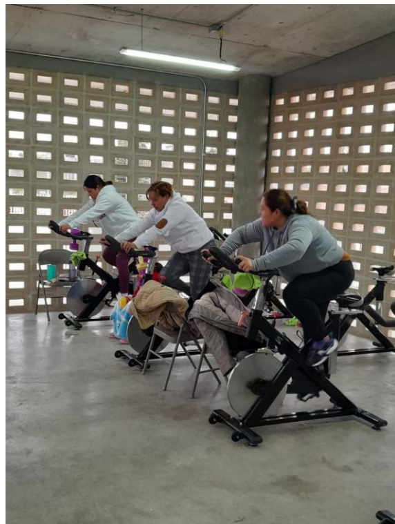
ACTIVIDADES DE LOS CENTROS DE DESARROLLO COMUNITARIO CDC's CUARTO TRIMESTRE OCTUBRE - DICIEMBRE 2023.