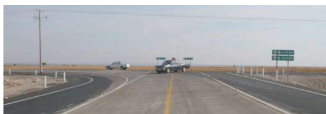
Modernización de Caminos Rurales

Se pavimentaron 12.48 Km., modernizando así 9 tramos carreteros, de los cuales: La Salada – Plan de Vallecitos, La Encantada – Estación Gutiérrez y Bañuelos - Entronque con Carretera a Durango se encuentran ya integradas al sistema carretero Federal, Estatal y Municipal; destacando también El Ahijadero – Monte Mariana, San José de Lourdes – Emancipación, El Salto – Torreón de los Pastores entre otros, beneficiando una población de 12,052 habitantes del medio rural, cumpliendo con los compromisos adquiridos con este importante sector de la sociedad.