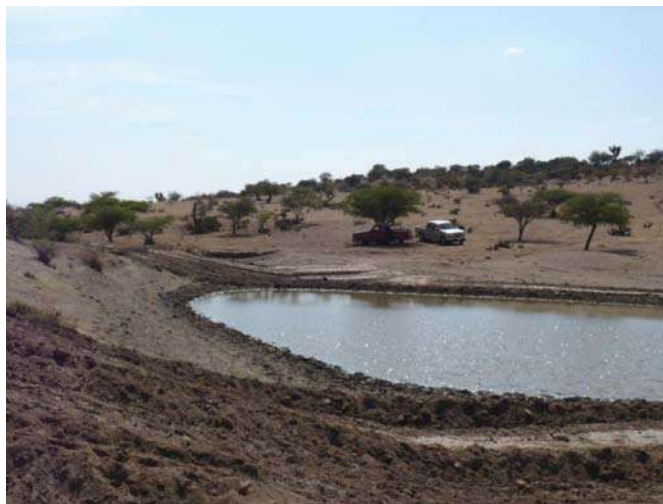
Construcción y Desazolve de Bordos Para Abrevadero

En este rubro se hizo un importante esfuerzo para resolver uno de los problemas más sentidos en el medio rural como es la falta de agua para su ganado; apoyando con maquinaria pesada a las comunidades de Tortuguillas, La Cantera, San Juan de la Casimira y Chichimequillas, con 217 horas maquina.